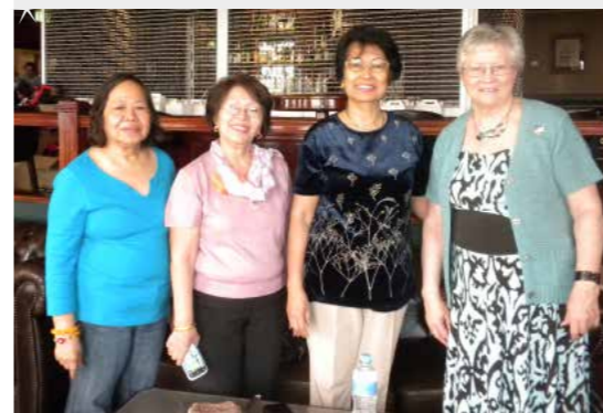
Hyggelig var det for meg å møte disse tre representantene under Verdenskongressen i Adelaide, Australia.

Filippinene har blitt hardt rammet av tyfon nå i november. La oss alle huske ekstra på de i bønn og gi penger til hjelpeorganisasjonene som er der!